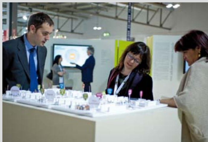
> Modulo da 16mq